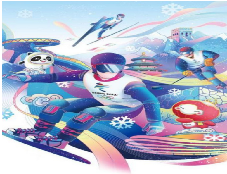
《健康中国 活力冬奥》。来源：北京冬奥组委