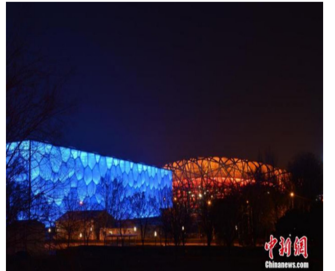
2021年12月14日，北京“冰立方”冰上运动中心通过竣工验收。