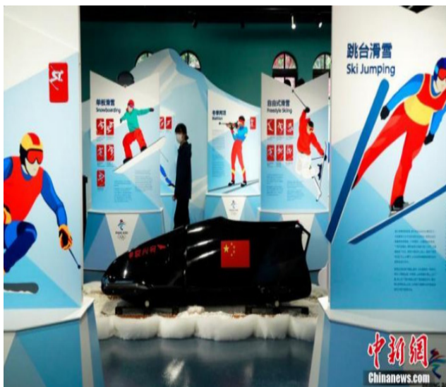
12月15日，“申城逐梦喜迎冬奥”上海迎接北京冬奥会开幕倒计时50天主题活动在体育大厦举行。