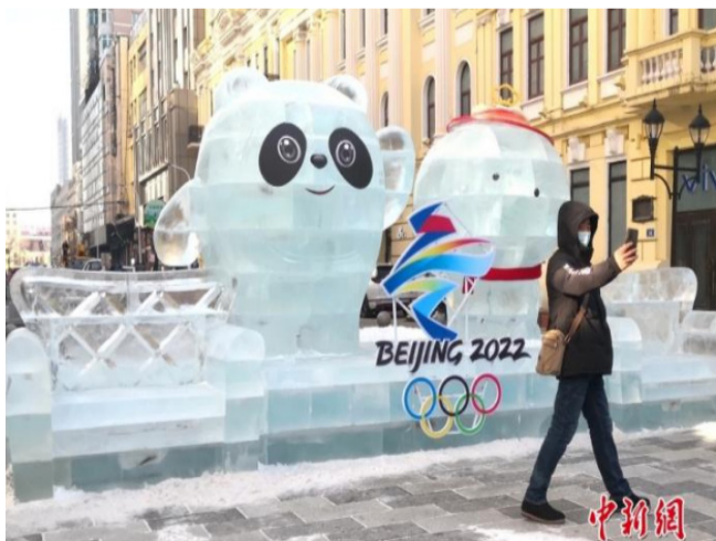
哈尔滨市道里区西九道街与中央大街交口，一座以2022年北京冬奥会吉祥物“冰墩墩”和冬残奥会吉祥物“雪容融”为主题的冰雕作品，吸引许多市民前来观看拍照。