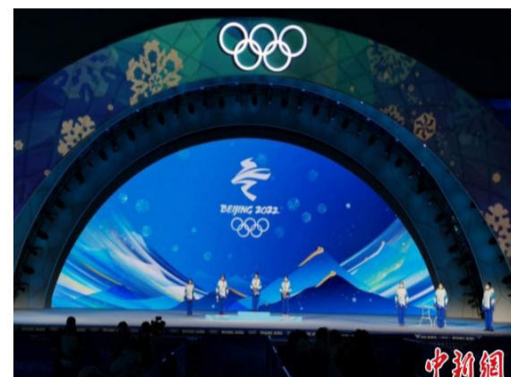
北京冬奥会北京赛区颁奖广场舞台交付。