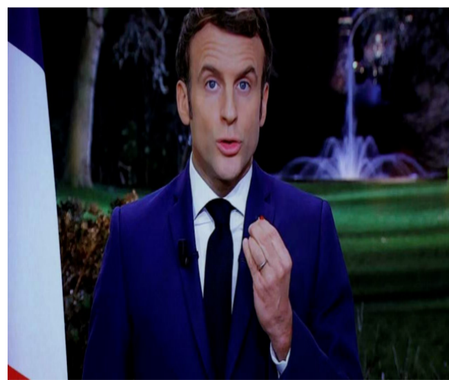
法国总统马克龙：希望“2022年是摆脱疫情的一年”