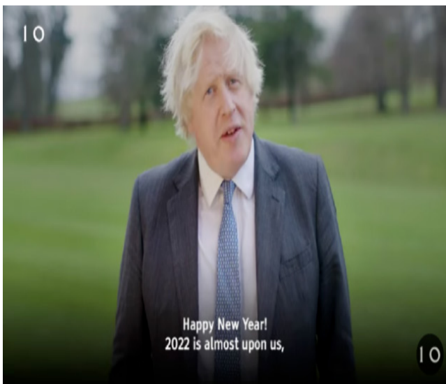
唐宁街1号发布英国首相约翰逊“新年致辞”，督促疫苗接种成重点之一