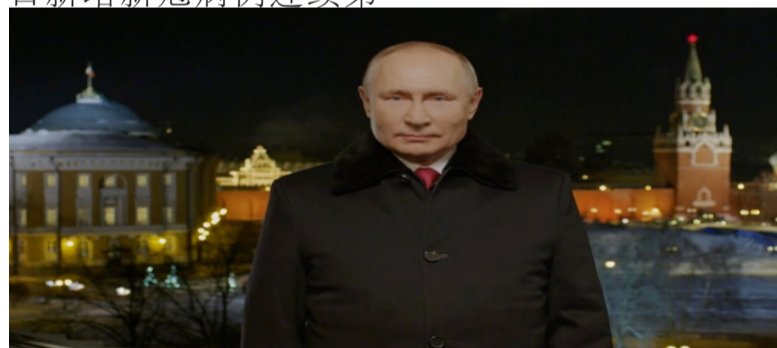
俄罗斯总统普京发表迄今为止最长的新年致辞——6分22秒，长达700字：赞扬团结，注重传统家庭价值观

· 此外，法兰西24电台称，马克龙还拒绝在演讲中确认他是否会像人们普遍预期的那样在2022年竞选第二个法国总统任期。他说，在4月选举后，他将继续为法国服务，“无论扮演什么角色”。