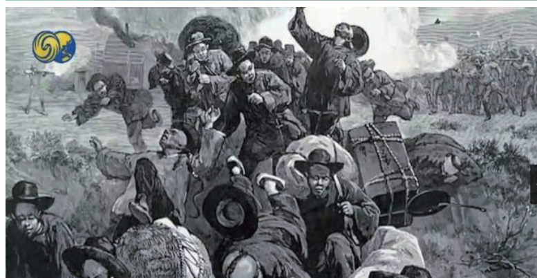
不做啞裔!華人定義新模範少數裔