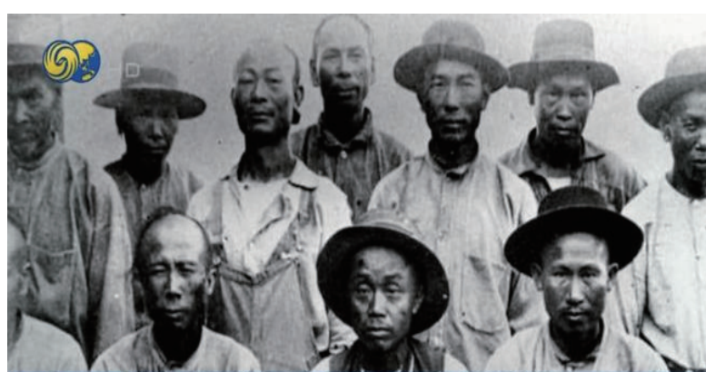
華人勤勞樸實特質反成白人眼中釘

关于华人该如何应对和改变歧视环境,阮桂铭说,要增强华人的文化自信,“在西方社会,如果你选择沉默,则代表你同意我的观点或没有意见,华人隐忍的性格让美国社会认为这是一种软弱的表现。华人应打破固有的印象,敢于发声。”(完)