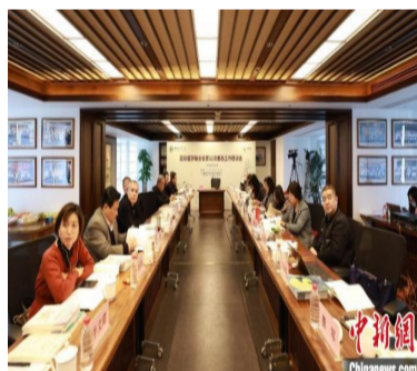
国际儒学联合会第12次普及工作座谈会暨优秀传统文化进校园研讨会举行