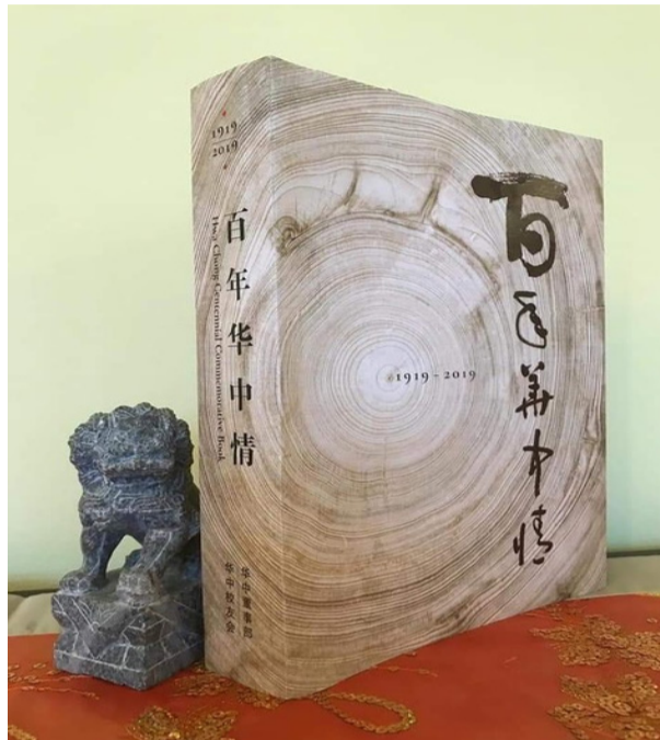
《百年华中情》，给母校百年华诞的献礼