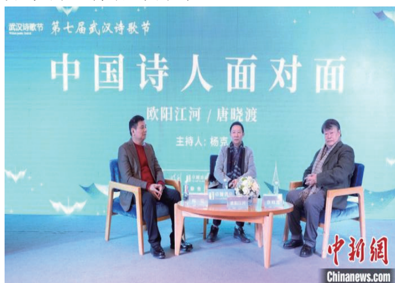
中国诗人面对面环节

人手稿展、第十三届闻一多诗歌奖评选颁奖、诗人面对面、“致青春·致武汉”诗漫江城——诗歌音乐会等活动。(完)