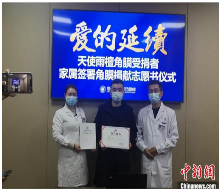
受捐者家属眼角膜捐献志愿书签署仪式现场。

在当天的签署仪式现场,马先生在《角膜捐献志愿书》上郑重签下自己的名字。他动情地说,在陪伴儿子等待眼角膜的那段日子里,每一天都生活在焦急与期盼之中。以前总觉得器官捐献离自己很遥远,在自己家人需要时这份期盼才感同身受。“在现实生活中,迫切需要的人实在太多,受雨檀感召,我志愿加入这个行列,以示感恩,回馈社会。”(完)