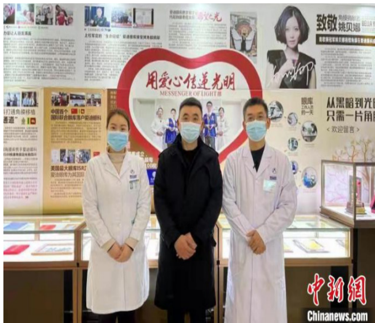
马先生(中)与医生在医院角膜捐赠墙前合影。