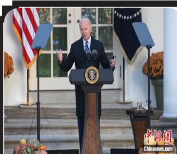
资料图：当地时间11月19日，美国总统拜登接受了任内首次年度例行体检。白宫医生表示，拜登身体状况良好，适合履行总统职责。图为拜登当天下午在白宫出席活动。

中新网12月23日电 据美媒报道，当地时间22日，美国总统拜登在接受采访时表示，他计划在2024年再次参选，而且如果特朗普参选，那么将会“增加这一可能性”。