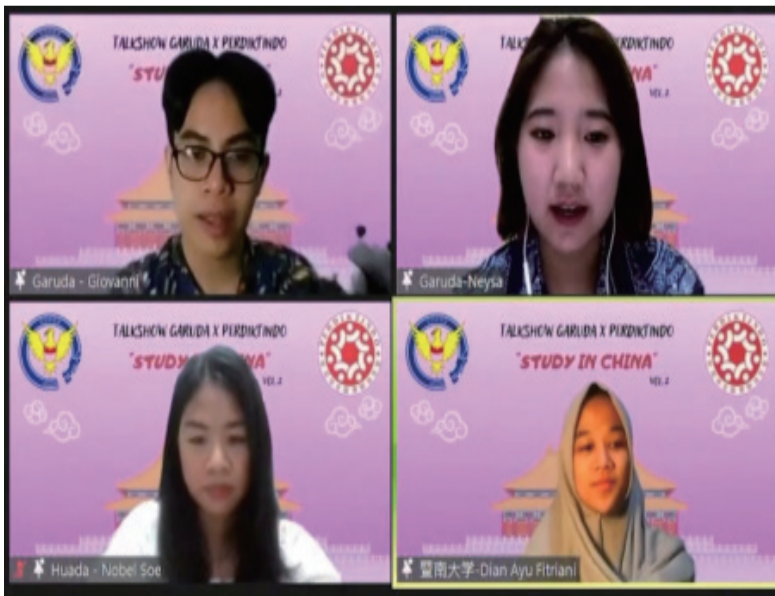
主持人与暨大师大在校生

12月18日晚上七点，第二期“留学中国”线上宣讲会正式揭开帷幕。第一期宣讲会已于10月15日顺利召开。本次宣讲会由印尼华文教育联合总会和印尼雄鹰（Garuda）学生会联合举办，目的是为了宣传华侨大学与暨南大学华文教育本科奖学金项目。印尼华文教育联合总会郑洁珊主席、各省协调机构领导及代表、印尼各地学生与家长共一百余人出席了本次宣讲会。