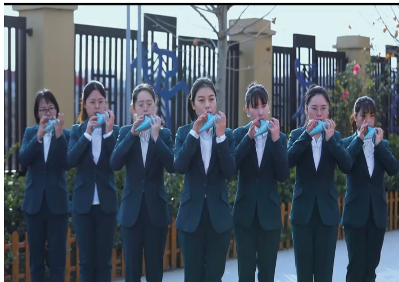
郑州育秀-荷音教师陶笛重奏乐团