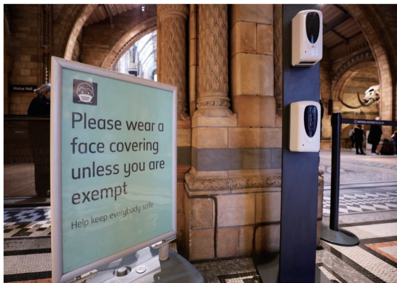
这是12月18日在英国伦敦自然历史博物馆门口拍摄的提醒人们佩戴口罩的提示牌。