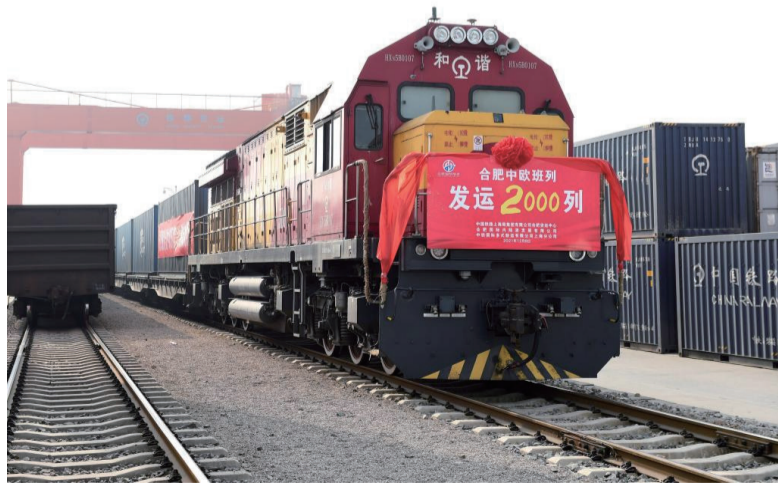
12月8日，在合肥北站物流基地，第2000列合肥中欧班列即将启程。