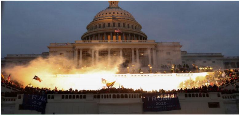
美退役将军称，国会骚乱表明美军中已有潜在动荡迹象

海外网12月19日电三名退役的美国将军周五(17日)警告说，如果美国在2024年大选后再次发生政变企图，该国已经分裂的军队可能会引发