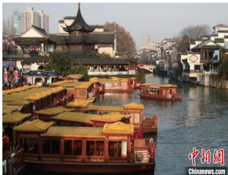
曾被朱自清感叹为“像逛古董铺子”的南京城南老城区将规划明清文学小路。(资料图)