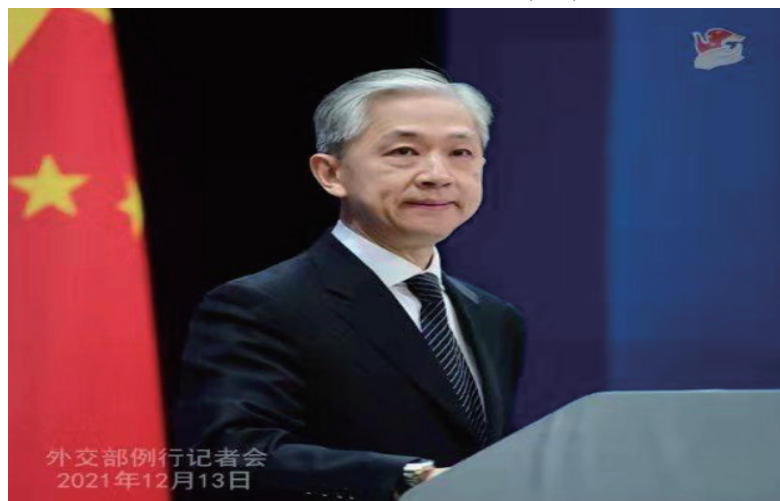
外交部发言人汪文斌。

事情，而不是分裂世界，为解决人类社会面临的各种问题设置人为障碍。”汪文斌指出。(完)