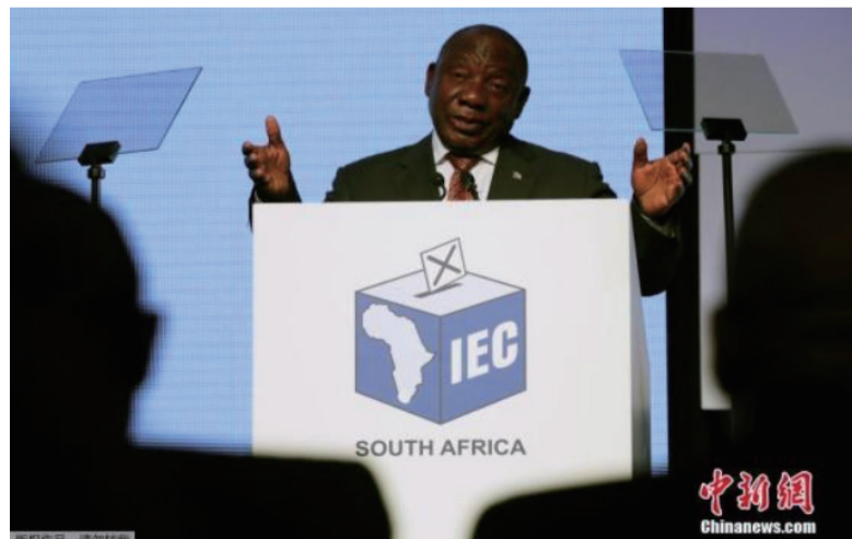
资料图：南非总统拉马福萨。

此前，拉马福萨率领南非外交代表团出访科特迪瓦、塞内加尔等非洲四国，并于12月8日返回南非。冈古贝尔指出，拉马福萨在四个国家访问期间，均接受了新冠病毒检测且均为阴性。