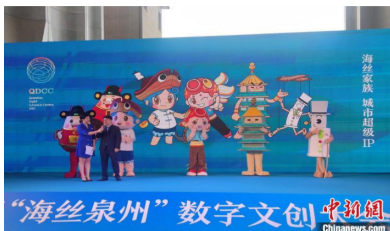
12月10日，2021“海丝泉州”数字文创大会上，鲤城超级城市IP“海丝家族”首次亮相。

本次大会期间，携程、华为、华侨城、视觉中国等业界头部企业将围绕数字文创主题进行高水平研讨对话；同时还将进行旅游推介及“世界遗产泉州荣耀”联名款手机宣传推介，并开展为期两天的“闽南美好生活嘉年华”文创展。(完)