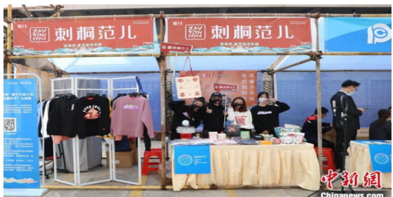
“闽南美好生活嘉年华”文创展。