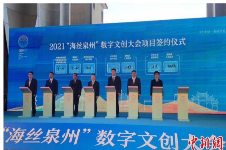
2021“海丝泉州”数字文创大会项目签约仪式。