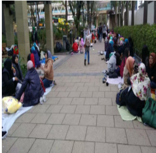
在香港铜锣湾休假的印尼佣工