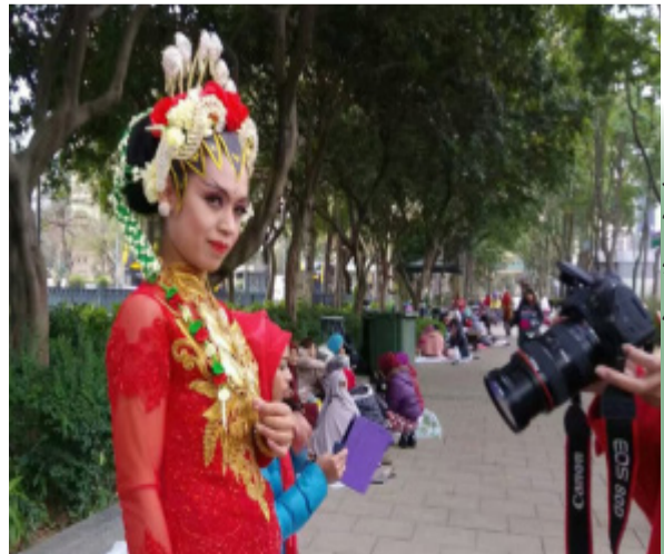
能歌善舞的印尼女佣是街头表演的主角