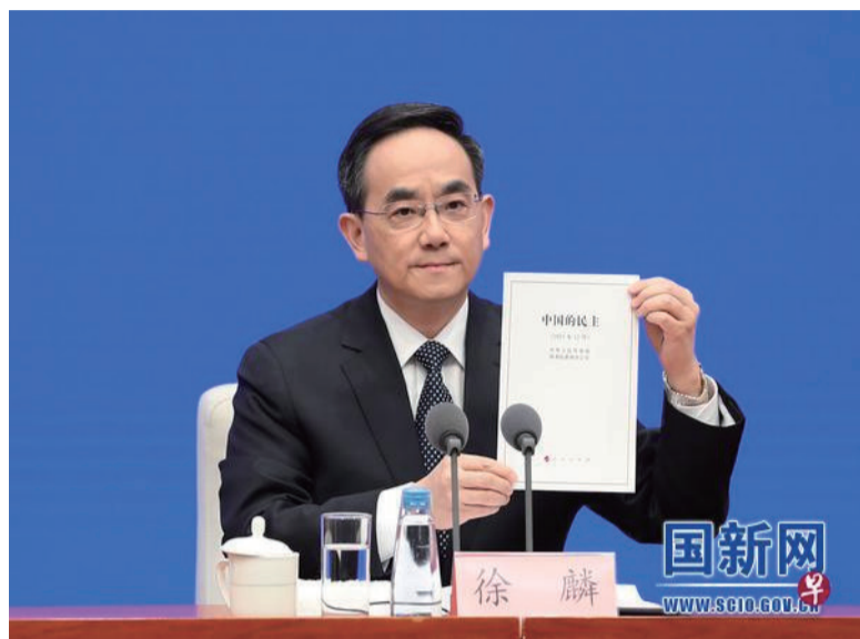
中共中央宣传部副部长徐麟4日在国新办发布会上介绍《中国的民主》白皮书。（国新网网站）

中共中央宣传部副部长徐麟回答《联合早报》提问时，批评美国自诩民主领袖组织操弄民主峰会，实为以民主为幌子，打压遏制与其社会制度不同、发展模式不同的国家。“这种假民主之名、行反民主之实的行径，将是人类民主发展史上的笑话，注定是不得人心的。”