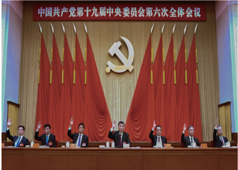
19届六中全会审议通过了三份历史决议。

“现在，距离第一个历史决议制定已经过去了76年，距离第二个历史决议制定也过去了40年。40年来，党和国家事业大大向前发展了，党的理论和实践也大大向前发