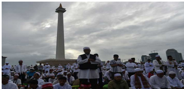
2016 年 12 月 2 日,抗议者聚集在雅加达国家纪念碑公园,作为反对前雅加达省长钟万学(Basuki “Ahok” Tjahaja Purnama)的集会的一部分。