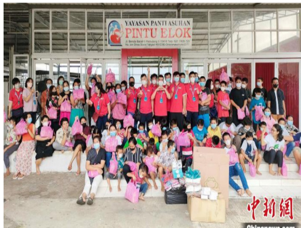
图为“世泉青”印尼分会部分理事与孤儿院工作人员和孩子们合影。

坚持团结抗疫。切实保障疫苗在非洲的可及性和可负担性。第二,深化务实合作。扩大贸易和投资规模,共享减贫脱贫经验,加强数字经济合作。第三,推进绿色发展。倡导绿色低碳理念,积极发展可再生能源,不断增强可持续发展能力。第四,维护公平正义。理直气壮坚持发展中国家的正义主张,把我们的共同诉求和共同利益转化为共同行动。(完)