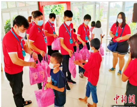
图为向孩子们分发爱心包。