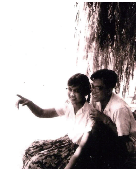
紫梦和戊草在西湖湖滨