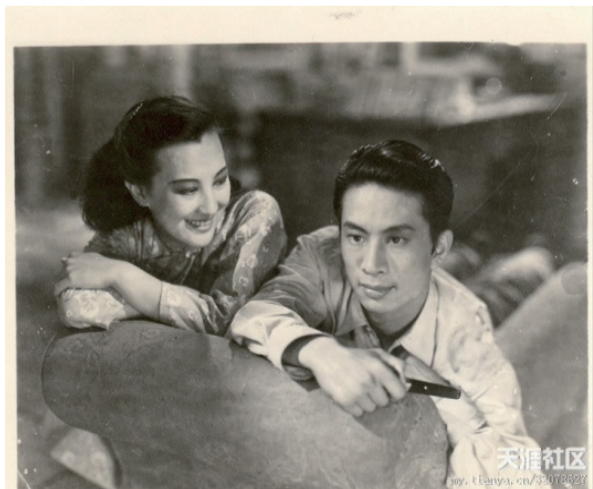
周璇和冯哲在《忆江南》