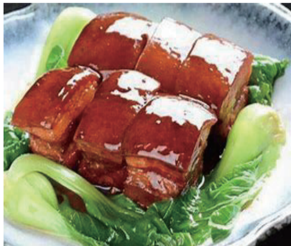
杭州楼外楼的东坡肉