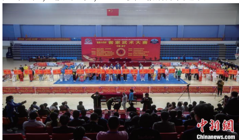
图为客家武术大赛。

明还将举办户外运动露营、山地骑行赛、马拉松比赛等体育活动，释放三明绿水青山的价值，扩大体育产业，壮大体育消费，推进国家体育消费试点城市建设。