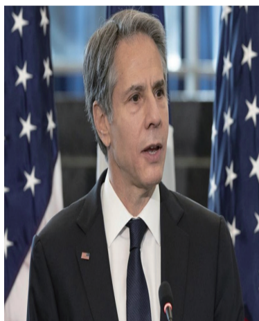
美国国务卿 布林肯