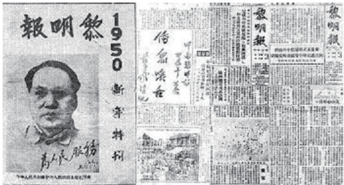
1950年的《黎明报》新年特刊