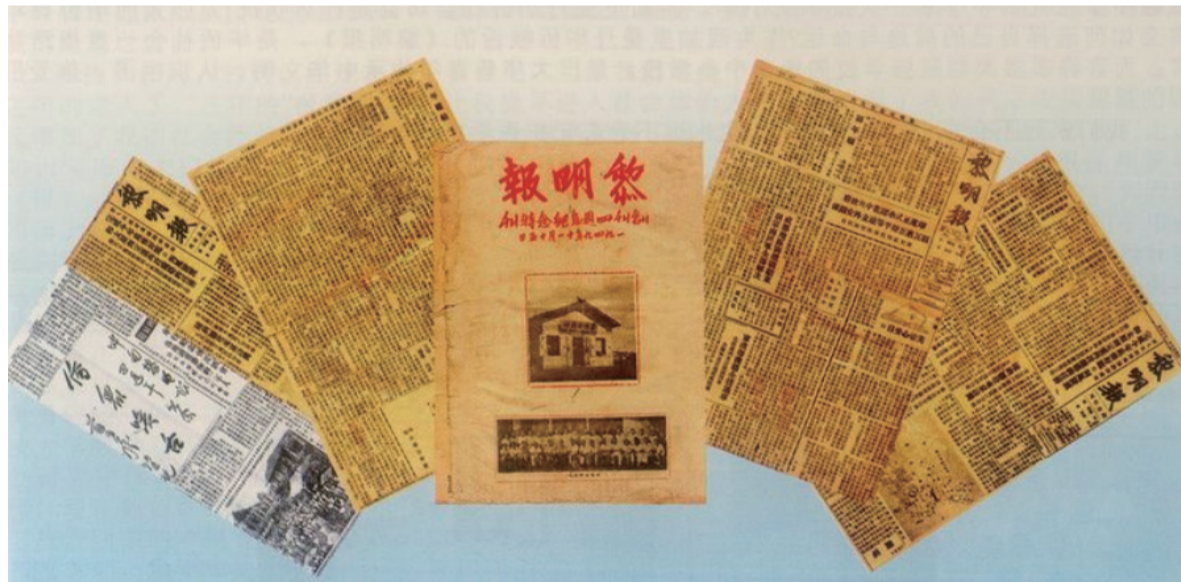
1949年11月创刊四周年纪念特刊