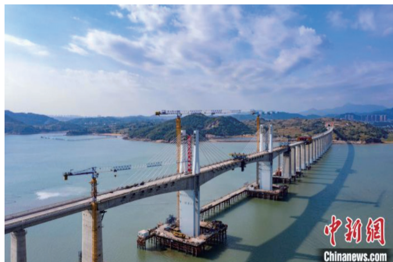
图为福厦高铁湄洲湾跨海特大桥当天成功合龙现场