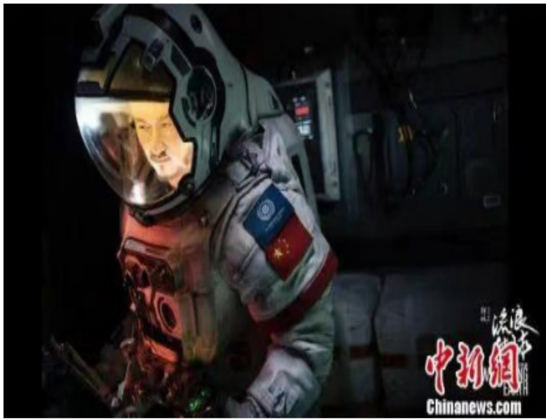
资料图：《流浪地球》官方宣传海报之一。

另一方面，从读者角度分析，中国科幻文学的受众群体依旧不是很大，这是由于缺少有影响力的中国科幻文学作品，更缺少有影响力的作家，这是该文学在中国发展的核心问题。目前，中国的科幻文学数量比美国科幻文学数量少很多，质量也有较大差距。