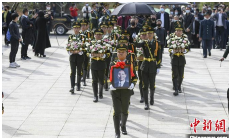
礼仪队将袁隆平的骨灰送入安葬地。