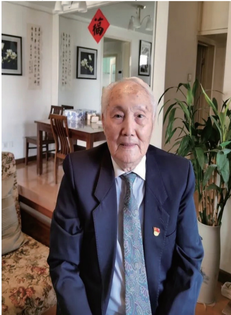
黄书海，男，1932年生，1986年入党，印尼归侨，中国驻美大使馆原一等秘书，曾获全国优秀新闻工作者等多项荣誉。