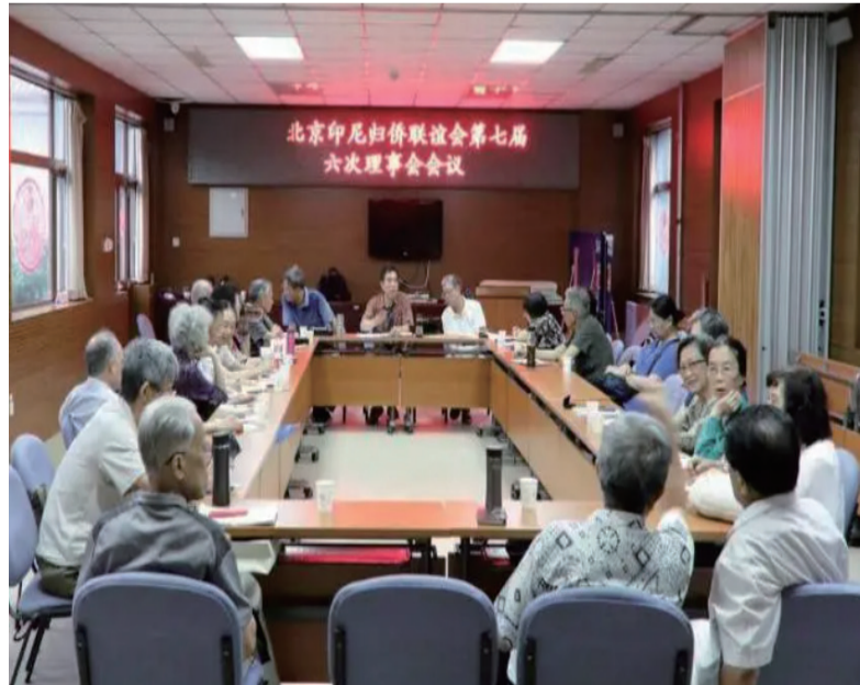
第七届六次理事会会议