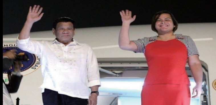
资料图：杜特尔特(左)和女儿莎拉。

菲律宾将在2022年5月举行全国和地方选举，选出新一届总统、副总统、国会议员、地方行政长官和议员等。菲律宾正副总统选举是分开举行的。依照菲律宾宪法，总统任期只限一任六年，不得连任。现任总统杜特尔特的任期将在2022年6月到期。