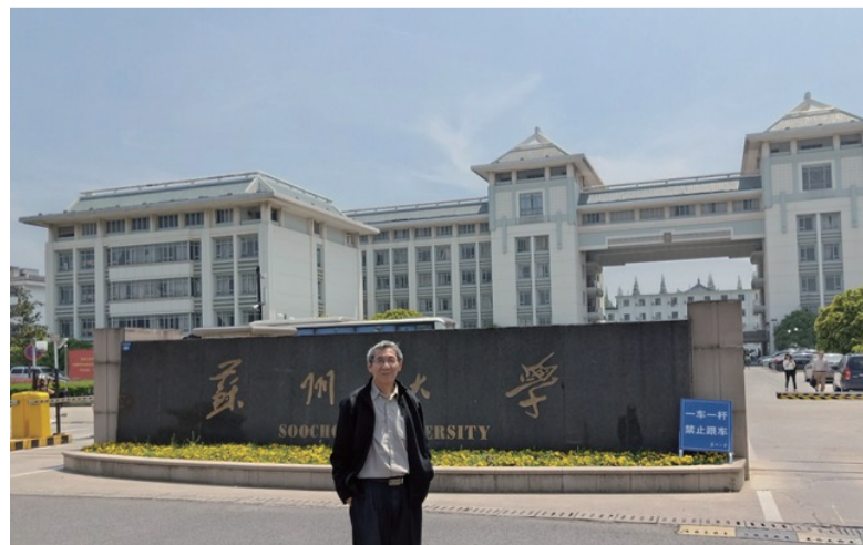
在苏州大学前留影