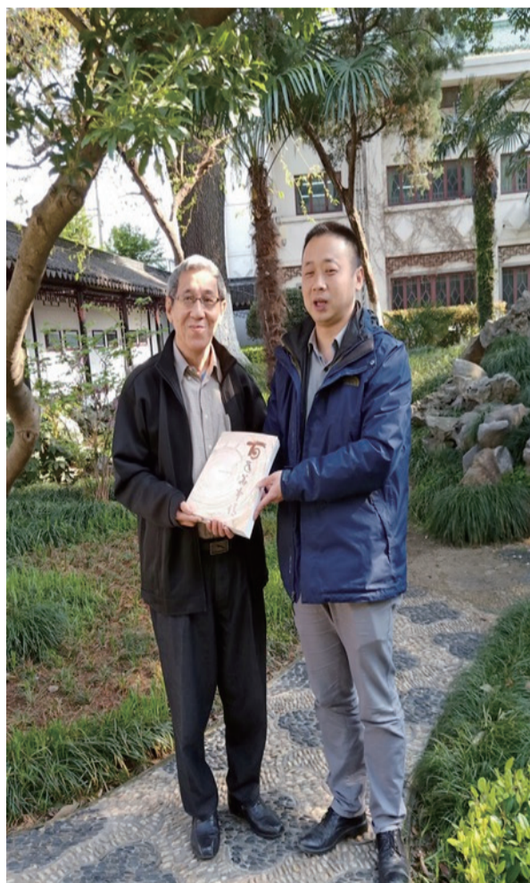
捐赠《百年华中情》予苏州图书馆，与负责人合影