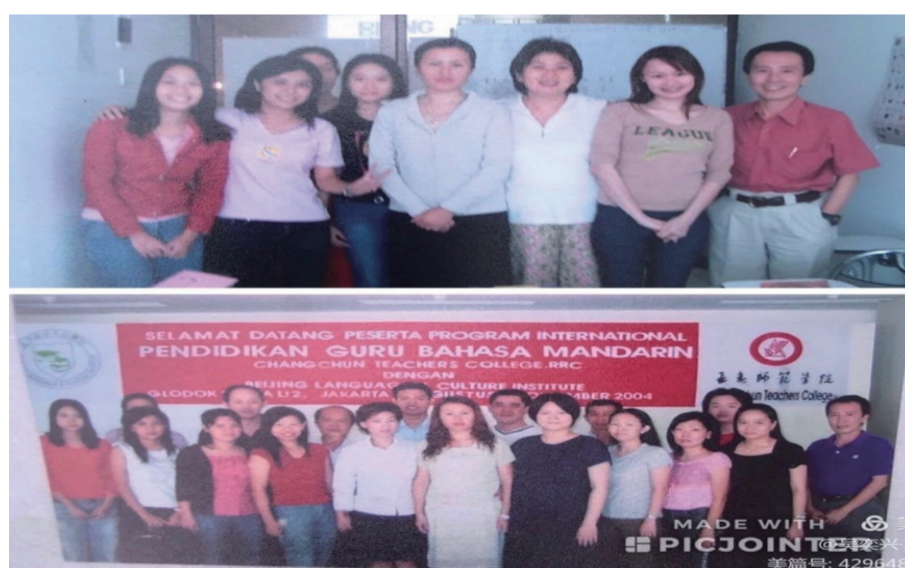
参加2004年教师培训班的同学们。