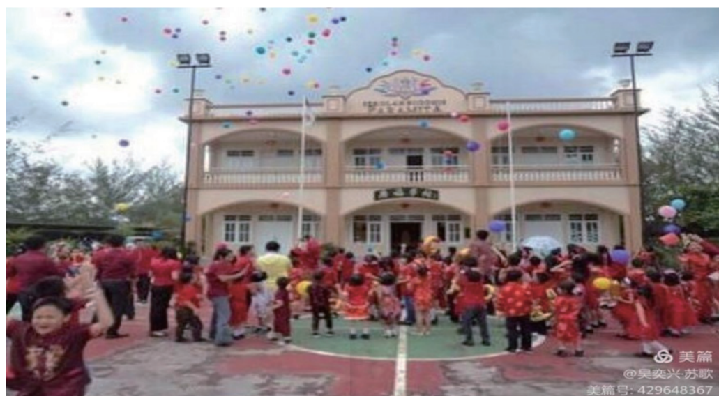
这是2017年校庆时放飞气球，放飞梦想！