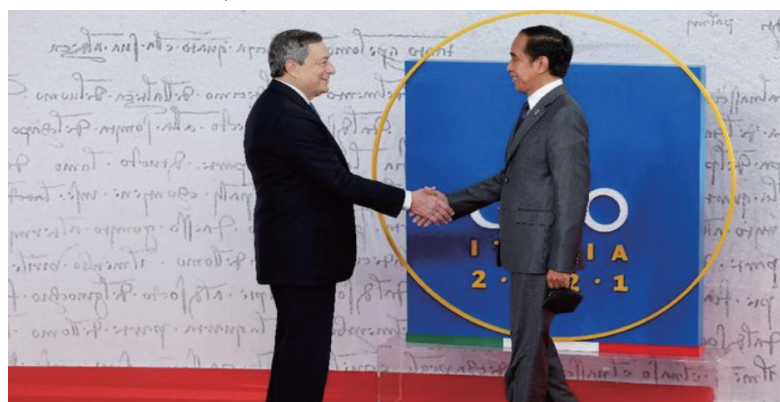
佐科维总统从意大利总理接手G20主席国