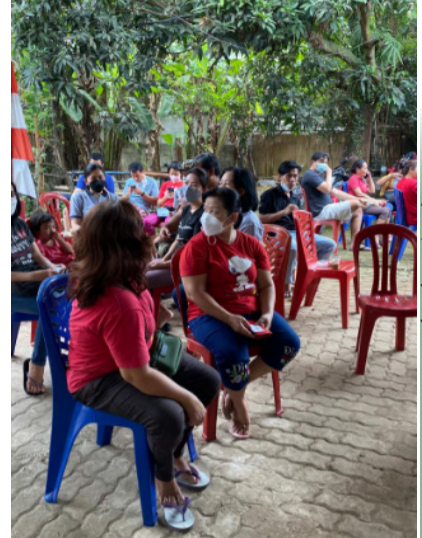
穿红色上衣是佛教青年团是捐血者。