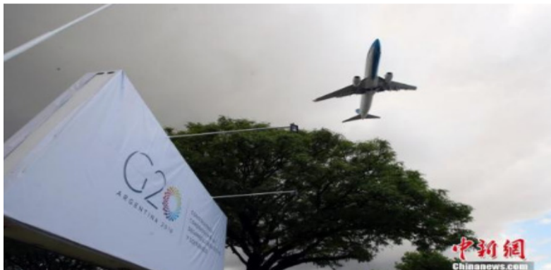
资料图：二十国集团(G20)领导人第十三次峰会国际媒体中心。

中新网10月30日电 据新加坡《联合早报》报道，G20首脑于10月30日和31日，在罗马举行会谈。根据草案，他们承诺采取紧急措施，以把全球气温的上升幅度控制在1.5摄氏度以内。