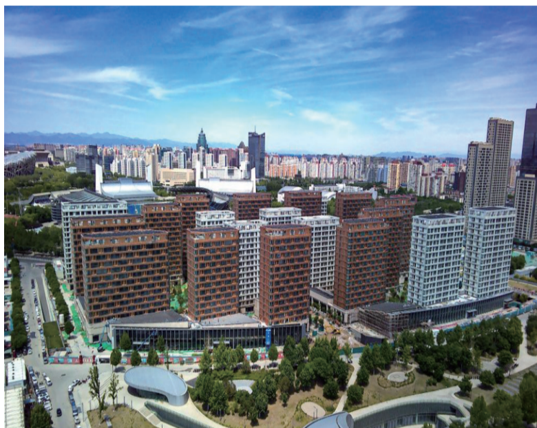
北京冬奥村完工外景。

新华社北京10月27日电(记者张悦姗、赵雪彤)记者从27日在京召开的国新办新闻发布会上获悉,目前针对2022年北京冬奥会和冬残奥会的各项准备工作已经就绪,冬奥村将于2022年1月27日开村。