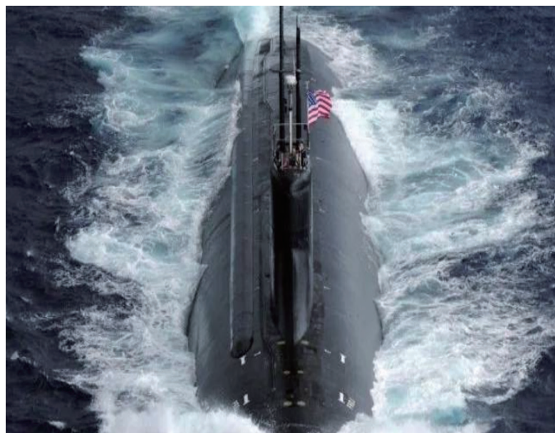
“康涅狄格”号在水面航行的历史照片