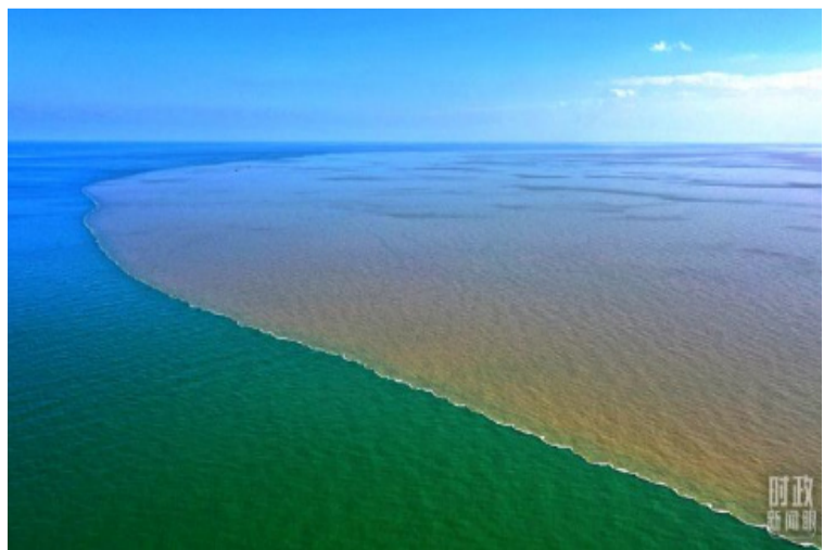
俯瞰入海口，雄浑的黄河与碧蓝的大海相融。