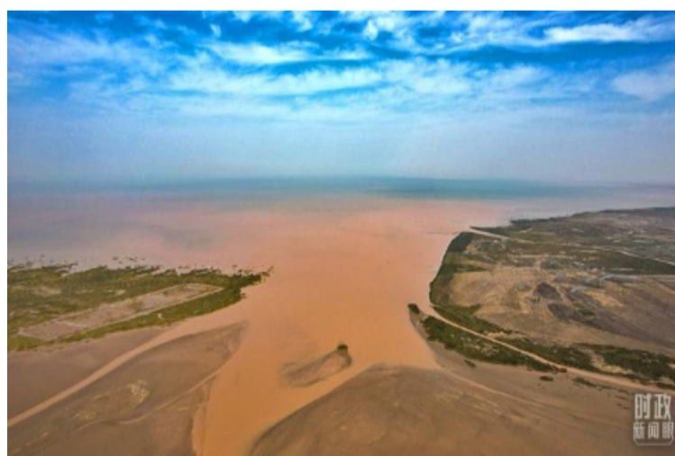
黄河入海口地处渤海和莱州湾交汇处。