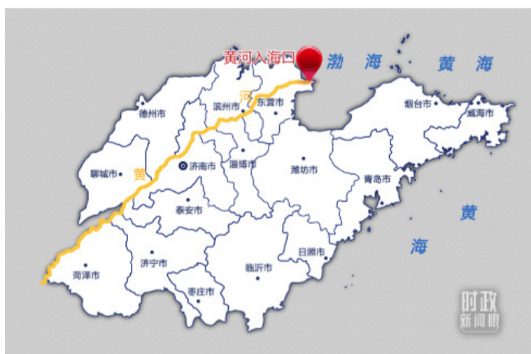
10月20日考察点示意图

据了解，黄河三角洲的鸟类已由1992年187种增加到371种，其中国家一级、二级保护鸟类分别有25种、65种。从去年3月至今，还首次发现火烈鸟、白鹈鹕、勺嘴鹬在这里栖息。