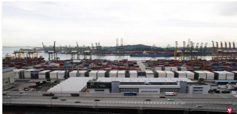
新加坡港口获选为“全球最佳海港”，这是我国港口首次获得AFLAS奖项殊荣。