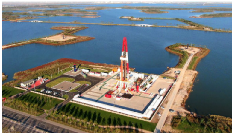
胜利油田在位于莱州湾的莱113区块实施CCUS项目（二氧化碳捕集、利用与封存），既能解决采收率低等问题，又能封存二氧化碳，实现了全链条绿色生产。