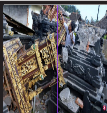
印尼巴厘岛周六早上发生4.8级的浅层地震，当地一座庙宇损毁严重。

中新网10月16日电 据“中央社”报道，当地时间16日凌晨，印尼巴厘岛发生里氏4.8级地震，目前已经至少导致2人死亡，7人受伤。有多名民众获救，仍有人受困建筑物中，地震造成灾区道路因山崩受阻，妨碍撤离工作进行。