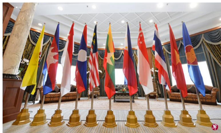
第38和第39届亚细安峰会和系列会议将于10月底举行。(档案照)

另一方面，美国国务院发言人普莱斯周五宣布，国务院高级官员乔莱星期天将启程访问印度尼西亚、新加坡和泰国。普莱斯说，乔莱(Derek Chollet)这次行程的目的之一是为解决缅甸危机。(完) 联合早报