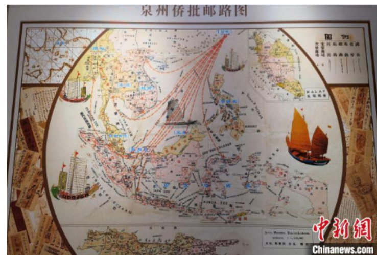
泉州侨批馆内展出的泉州侨批邮路图。