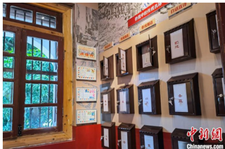
馆藏侨批实物与华侨故居相得益彰。