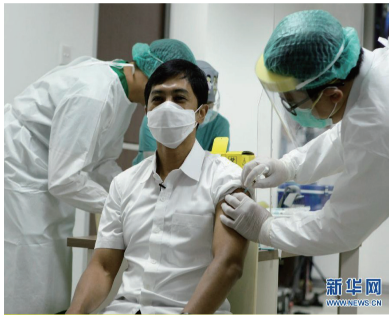
资料图：2021年1月14日，在印度尼西亚雅加达的西普托·曼贡库苏莫医院，印尼卫生部副部长萨克索诺（中）接种中国科兴公司的克尔来福新冠疫苗。