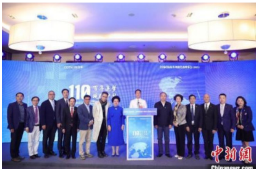
10月6日，全球各界侨领纪念辛亥革命110周年活动现场。