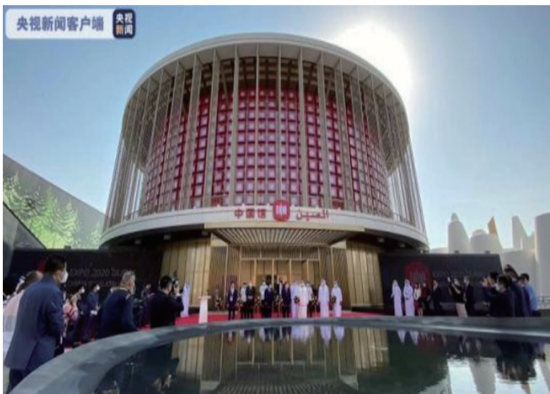
迪拜世博会中国馆开馆仪式

当地时间10月1日，2020年迪拜世博会中国馆盛装揭幕，正式开门迎客。“云上中国馆”同步上线，中外观众不到现场也可以远程参观。