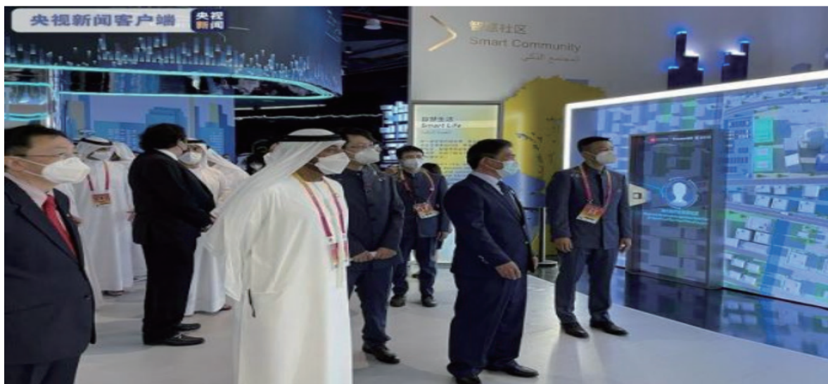
迪拜世博会中国政府总代表、中国贸促会副会长张慎峰（前排右二）；中国驻阿联酋大使倪坚（前排左一）；迪拜2020年世博会高级委员会主席谢赫·艾哈迈德·本·赛义德·阿勒马克图姆（前排左二）