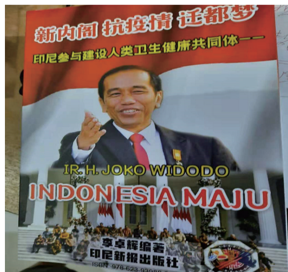
<新内阁、抗疫情、迁都梦>封面