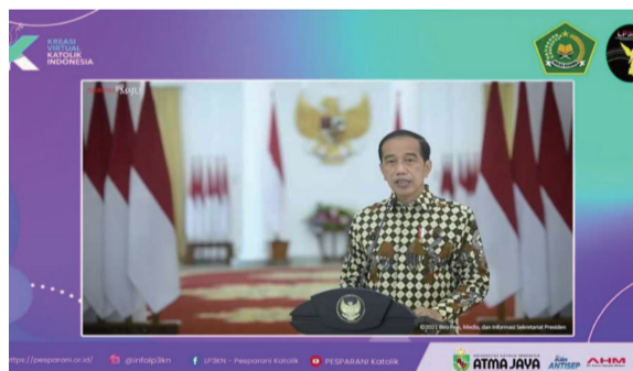
总统在巴布亚主持印尼天主教视频论坛开幕

查雅普拉县、米米卡县和马佬奇市，共有34省6700多运动员参赛，教练和工作人员近4000人。军警出动7800名特别部队全力保安。政府允许观众以严格卫生保障和规范进入参观，限定最高50%人数。全运会将于2日至15日举行，随后还将举办残运会。（李全）