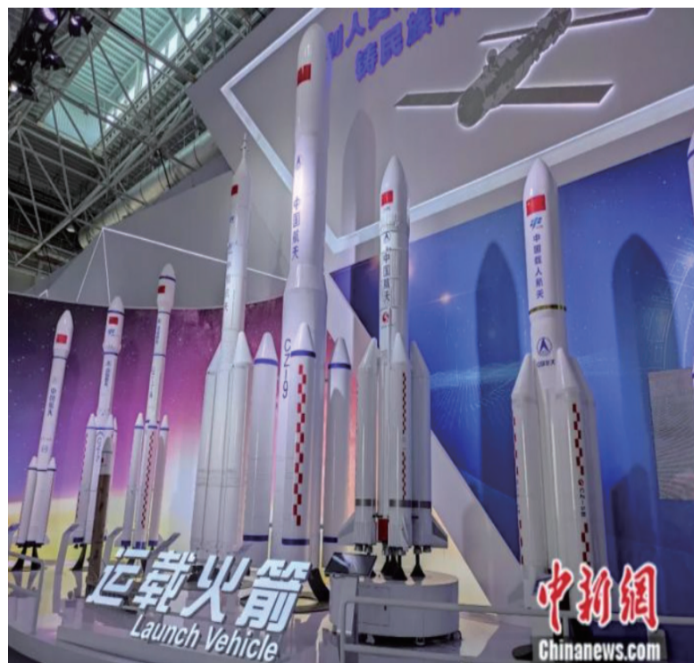
长征运载火箭“家族”模型。