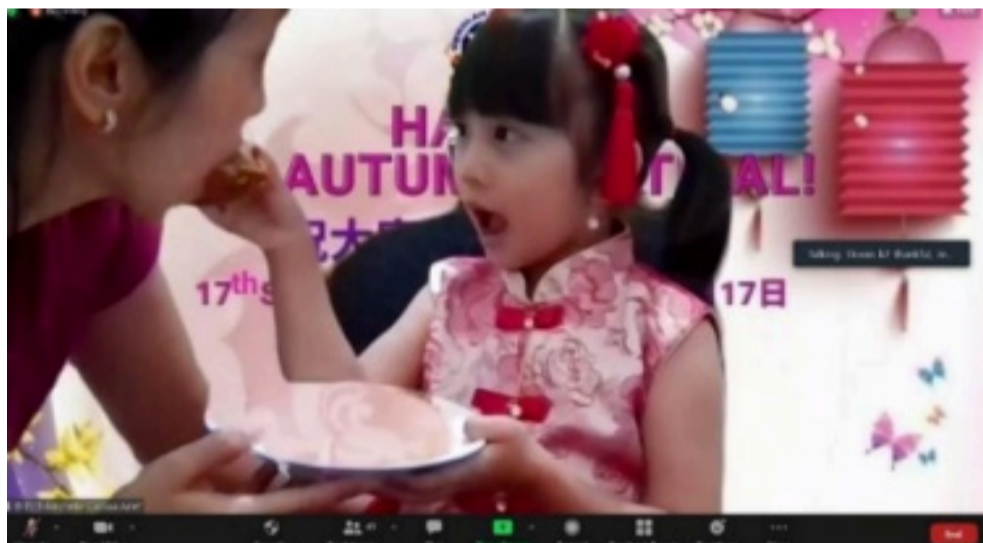
大班小朋友和妈妈分享月饼