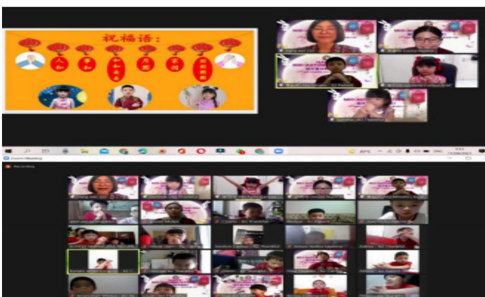
大班师生送上祝福