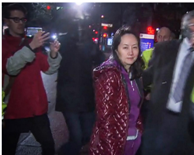
(视频截图)当地时间2018年12月11日，加拿大温哥华，加拿大法院作出裁决，批准华为公司首席财务官孟晚舟的保释申请，孟晚舟离开法院。