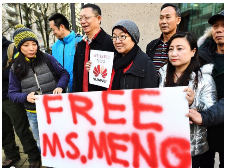
当地时间2018年12月10日上午10点，加拿大不列颠哥伦比亚省高等法院外面，有华人群众举起标语，要求释放孟晚舟女士。