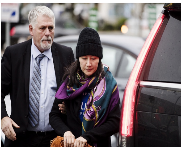
当地时间2018年12月12日，加拿大温哥华，在获准保释后华为CFO孟晚舟在安保陪同下出门。