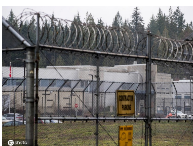
图为关押孟晚舟的温哥华艾略特女子矫正中心。