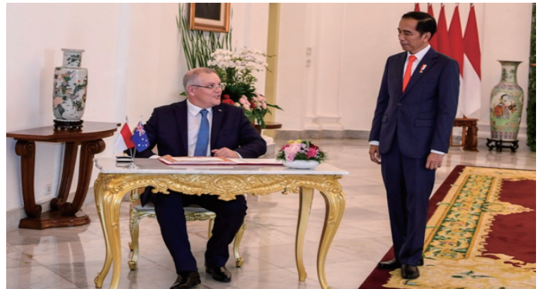
佐科维（右）与澳总理莫里森（左）